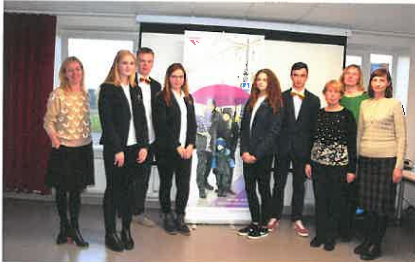
7 pav. Nacionalinio projekto „Nepamiršk parašiuo“ finalinis renginys

2017 m. sėkmingai tęstines projektines veiklas vykdė Utenos vaikų ir jaunimo užimtumo centras (toliau – VJUC). 2017 m. VJUC teikė neformaliojo vaikų švietimo paslaugas Utenos rajono vaikams ir jaunuoliams bei bendrosios ir specialiosios socialinės paslaugas pagal socialinių paslaugų katalogą dienos centrą lankantiems vaikams ir jų šeimoms. 2017 m. VJUC veikė 14 įvairaus pobūdžio būrelių/studijų, kuriuose dirbo 11 neformaliojo švietimo mokytojų. VJUC veikė 2 skyriai: dienos centras ir atviras jaunimo centras (toliau –AJC). AJC dirba 2 jaunimo užimtumo specialistai, lankosi daugiau nei 70 jaunuolių. AJC darbuotojai užmezga kontaktą ir palaiko tvarų, lygiavertį santykį su jaunais asmenimis; nustato ir įvertina jaunimo poreikius, užtikrina saugią aplinką ir jų realizavimo sąlygas; teikia jauniems asmenims individualią pagalbą sudėtingose situacijose.