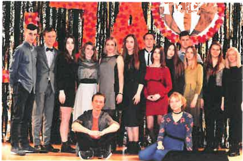
4 pav. Renginys „Jaunimo apdovanojimai 2017 m.“

2017 m. bendradarbiaujant su Vilniaus Socialinių mokslų kolegija suorganizuotas jaunimui renginys „Kūrėjų karta“, dalyvavo per 100 rajono jaunimo atstovų. Taip pat Utenos rajono savivaldybė skyrė finansavimą 2017 m. rugpjūčio 7 – 11 dienomis Antalietėje vykdytame LMS Utenos mokinių savivaldų informavimo centro vasaros forume „Kaip prisijaukinti sėkmę 2017“. Lietuvos moksleivių sąjungos padalinių savanoriai, atvykę iš Lietuvos miestų bei miestelių, 5 dienas praleido, klausydami paskaitų, dalyvaudami darbo grupėse, simuliacijose bei socializacijose.