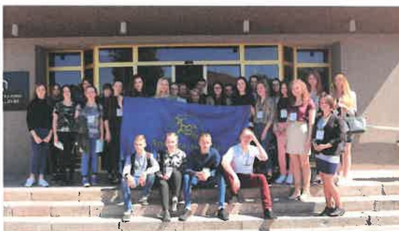
2 pav. Renginys „Jaunimas savivaldybėje 2017“ Utenos rajono savivaldybėje

Renginiai, kuriuose gali dalyvauti rajono jaunuoliai, viešinami Utenos rajono jaunimui veiktas vykdančių nevyriausybinių organizacijų tinklalapiuose, rajono savivaldybės „facebook“ paskyroje ar svetainėje adresu www.svietimas.utena.lm.lt/TVS/jaunimui , UVJOS „Apskritasis stalas“ internetinėje svetainėje: www.uvjosas.lt ir kt.