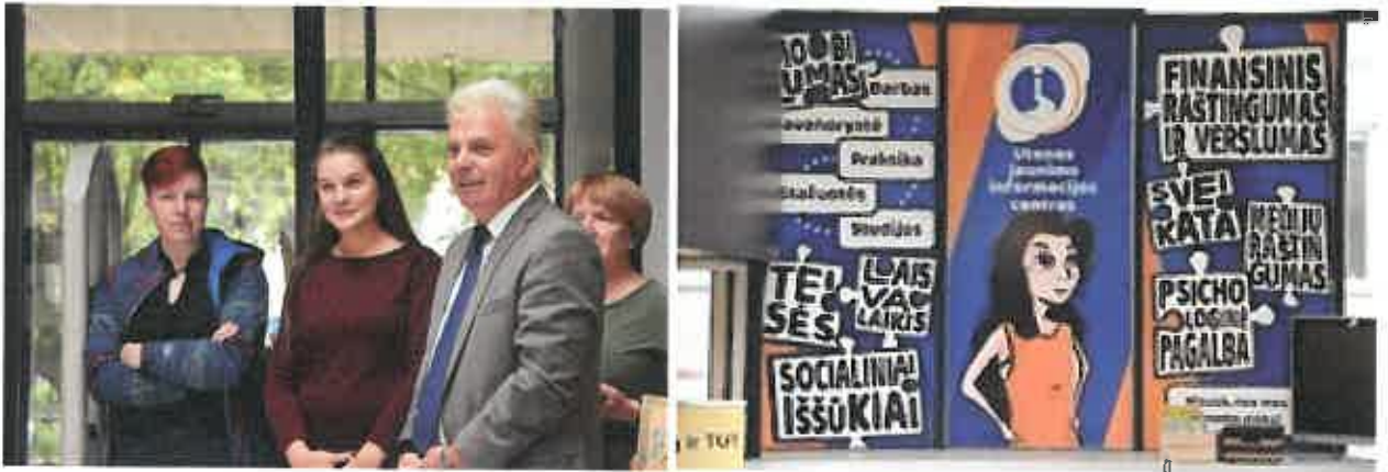
6 pav. Jaunimo informacijos centro atidarymas Utenos A. ir M. Miškinių viešojoje bibliotekoje

informacijos centrą (toliau - Utenos JIC). Utenos JIC galima rasti jaunimui aktualią informaciją, čia teikiamos konsultacijos – nuo tarptautinės savanorystės programų iki vietinių renginių Utenoje. Utenos A. ir M. Miškinių viešojoje bibliotekoje įsikūrusiame jaunimo informacijos centre konsultacijos teikiamos jaunimui nuo 14 iki 29 metų.