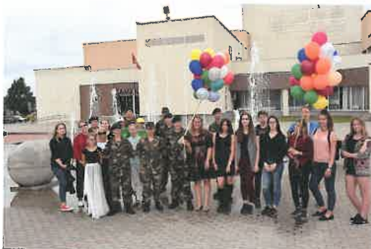
3 pav. Tarptautinė jaunimo diena 2017 m.

Vykdamas valstybės perduotą savivaldybei jaunimo teisių funkciją - jaunimo teisių apsaugą ir užtikrinant jaunimo politikos plėtrą, ataskaitiniais metais rajono jaunimas turėjo galimybę dalyvauti daugiau kaip 20 susitikimų/mokymų/renginių: mokymuose „Papildomos poilsio dienos Tavo ugdymosi) sąskaitoje: ką gali per jas nuveikti gerinant mokinių pasiekimus“, apskritojo stalo diskusijose „Galimybės ir iššūkiai skatinant jaunimo užimtumą“ ir „Darbo su jaunimu formos: iššūkiai ir geroji patirtis“ „Ju2“ renginyje, regioniniame pilietiškumo ir socialinės atsakomybės finansinio raštingumo projekte „Nepamiršk parašyto“, nacionaliniame jaunimo garantijų iniciatyvos projekte „Atrask save“, Priklausomybėms - ne“, nacionaliniame darbo su jaunimu forume „Ateik. Išgirsk. Dalinkis“, renginyje „IDĖJA+“, iniciatyvoje „Muzika, suburianti mus“, akcijoje „Taikos glėbys“, Tarptautinės savanorystės dienos paminėti praktikos cikle „Pasimatuoti savanorystę“, „Jaunimas savivaldybėje“, miesto šventės renginyje „Jaunimo taškas“, „Jaunimo apdovanojimai“, „Tarptautinė jaunimo diena“, „Pilietiškumo mokykla 2017“, „Nyaaa!2017“, „LMS padėkos vakaras 2017“, „Tarptautinė jaunimo diena“, „Jaunimo taškas“, „Profesijų savaitė“, „Juventus“ krepšinio lyga“ ir kt. Utenos JRT taip pat prisideda ir (ar) teikia pasiūlymus dėl organizuojamų miesto, valstybinių švenčių, Tarptautinių dienų minėjimo, įgyvendina su jaunimo politika susijusius visuomeninius projektus.