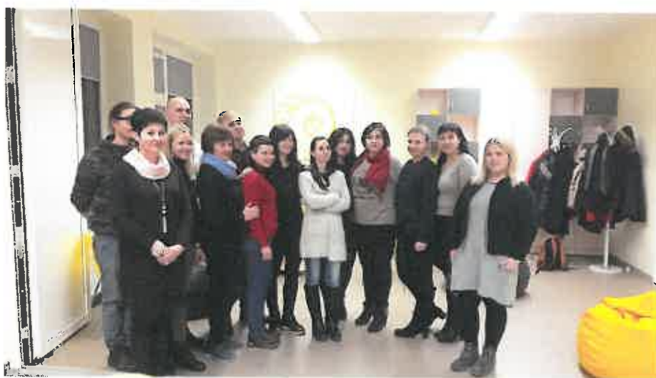
9 pav. Ukrainos Jaunimo ir sporto ministerijos ir NVO organizacijos „SOS vaikai“ atstovų vizitas Utenos rajono savivaldybėje

www.regionunaujienos.lt/ukrainos-jaunimo-organizaciju-atstovu-vizitas-utenoje/ .