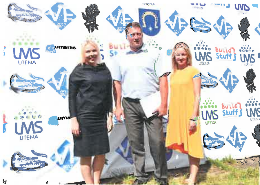
5 pav. LMS vasaros forumas „Kaip prisijaukinti sėkmę“ 2017

2017 m. bendradarbiaujant su Vilniaus Socialinių mokslų kolegija suorganizuotas jaunimui renginys „Kūrėjų karta“, dalyvavo per 100 rajono jaunimo atstovų. Taip pat Utenos rajono savivaldybė skyrė finansavimą 2017 m. rugpjūčio 7 – 11 dienomis Antalietėje vykdytame LMS Utenos mokinių savivaldų informavimo centro vasaros forume „Kaip prisijaukinti sėkmę 2017“. Lietuvos moksleivių sąjungos padalinių savanoriai, atvykę iš Lietuvos miestų bei miestelių, 5 dienas praleido, klausydami paskaitų, dalyvaudami darbo grupėse, simuliacijose bei socializacijose.