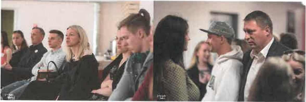
8 pav. Utenos ir Švenčionių rajono savivaldybių strateginės partnerystės jaunimo politikos srityje susitikimas Švenčionių rajone

bendradarbiavimą jaunimo politikos įgyvendinimo srityje ir įgyvendinant vieną iš Jaunimo reikalų departamento prie Socialinės apsaugos ir darbo ministerijos ir jaunųjų profesionalų programos „Kurk Lietuvai“ pilotinio projekto uždavinių.