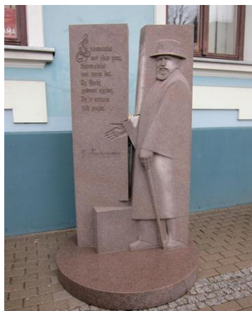
Paminkle iškalti šie žodžiai: „Lietuvininkais esame mes gimę, lietuvininkais turime ir būt“.