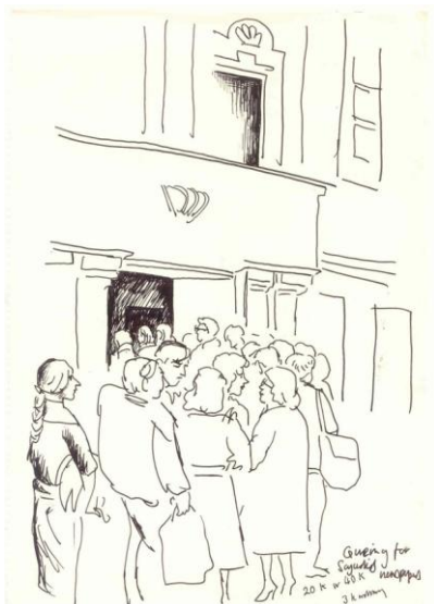
Eilė prie Sąjūdžio spaudos

Šaltinis F Iš V. Landsbergio knygos „Lūžis prie Baltijos“