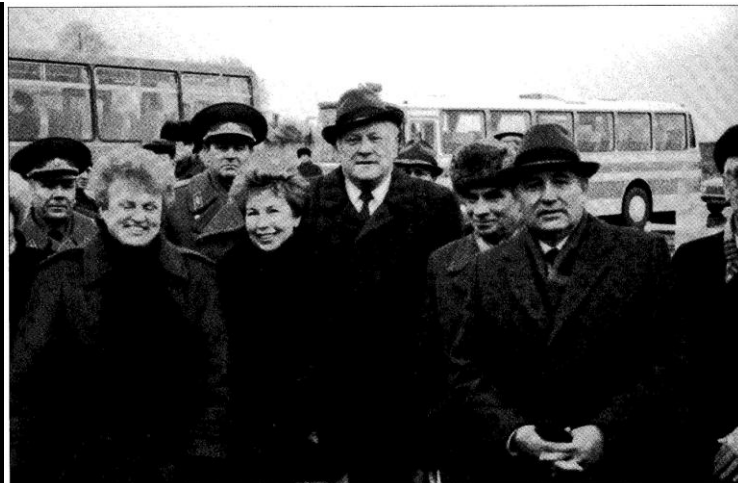
Sutikimas Vilniaus oro uoste

Šaltinis C Ištrauka iš LKP CK II plenumo 1990 m. sausio 17 d. priimto LKP CK kreipimosi į Lietuvos rinkėjus.