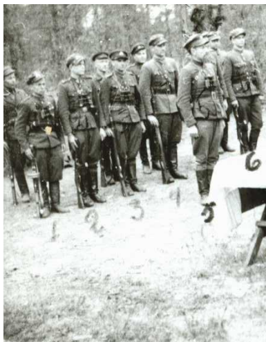
Partizanų rikiuotės nuotrauka