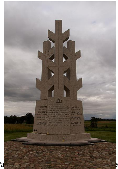
Partizanų kovos vado paminklas

31. Remdamiesi šaltiniais A ir B, išskirkite tris veiklas, kurias vykdė sovietų valdžios šalininkai. Paaškindite, kodėl jie ėmėsi šios veiklos?