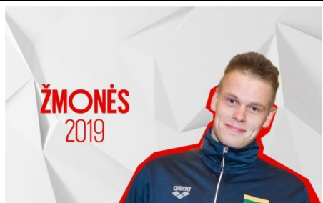
Danas Rapšys – 2019 metų sporto žmogus

Plaukikui Danui rapšiai įteiktas 2019 metų Metų sporto žmogaus apdovanojimas. Kinijoje gruodį vykęs pasaulio čempionatas buvo itin sėkmingas – plaukdamas 400 metrų laisvu stiliumi sportininkas iškovojo aukso medalį. Distanciją jis įveikė per 3:34,01 minutės ir pagerino ne tik Lietuvos, bet ir pasaulio rekordą. Tai didžiausia Dano pergalė, bet medaliai jam nebuvo nauji: Europos čempionate jis laimėjo bronzos medalį 200 metrų plaukimo nugara varžybose, o netrukus tapo čempionu 200 metrų plaukimo laisvuju stiliumi rungtyje.