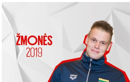
Danas Rapšys – 2019 metų sporto žmogus

Plaukikui Danui rapšiai įteiktas 2019 metų Metų sporto žmogaus apdovanojimas. Kinijoje gruodį vykęs pasaulio čempionatas buvo itin sėkmingas – plaukdamas 400 metrų laisvu stiliumi sportininkas iškovojo aukso medalį. Distanciją jis įveikė per 3:34,01 minutės ir pagerino ne tik Lietuvos, bet ir pasaulio rekordą. Tai didžiausia Dano pergalė, bet medaliai jam nebuvo nauji: Europos čempionate jis laimėjo bronzos medalį 200 metrų plaukimo nugara varžybose, o netrukus tapo čempionu 200 metrų plaukimo laisvuju stiliumi rungtyje.