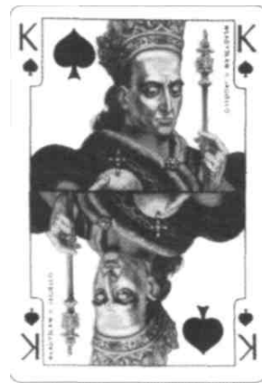
Jogailaičių malka, 2001. Karalius Jogaila – vynu karalius.

Prieš rinkimus Vilniaus krašte. Karalius Jogaila ant Vilniaus sienų. Žmonės! Istorijos laikrodis išmušė dvyliktą valandą! Atsiminkite tai ir prieš rinkimus, kad jūsų broliai iš Varšuvos tikrai galėtų pasiųsti savo ginkluotus sūnus ginti Vilniaus nuo priešų iš Rytų ir Šiaurės.